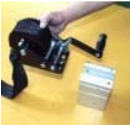
JL304 オプションブラケットへの取付

②ハンドルを角根ボルトに差込、角ワッシャー、ナットにて取付けます。 ベルトを巻き上げて完成です。