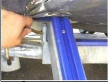
ストッパーピンにて固定