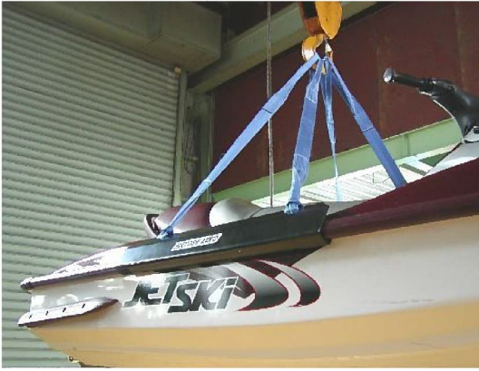
ホイストにて使用例写真