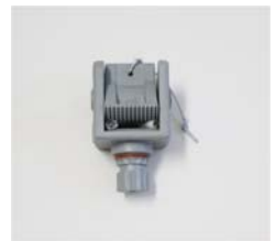
アンカーロープ用クリート

品番 : BK-AL002G 品名 : アンカーロック 価格 : ¥7,000+税 カラーグレー