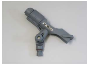
ロッドホルダーのみ

品番 : BK-HT213G 品名 : ロッドホルダー 価格 : ¥5,900+税 カラーグレー