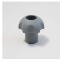
交換用ノブナット

品番 : BK-KN222G 品名 : ノブナット ロング 価格 : ¥800+税 カラーグレー