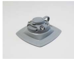
ベースマウントのみ

品番 : BK-FMS224G 品名 : ベース&マウント 粘着シート付 価格 : ¥5,000+税 カラーグレー