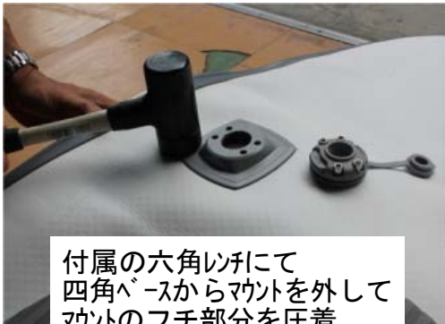
付属の六角レンチにて 四角ベースからマウントを外して マウントのフチ部分を圧着

接着する材料表面の油分、水分、ほこりを除去してください。 使用艇の場合は塩分が付着していますので 適度な温度のお湯で塩分洗浄し脱脂を行ってください。 作業室温が20℃以上であることが望ましいです。 接合部に50N（約5kg）ほどの圧をかけて圧着してください。 ゴムハンマー等で圧着が望ましいです。ハードボードの場合はハンマーの叩きすぎにご注意ください。 インフレーターの場合は空気が抜けた状態で圧着しやすいように取付位置のボードの下に台座等を敷き平らな状態にしてムラなく圧着してください。 レール部分など、R形状部分に接着する場合は入念に圧着をしてください、圧着があまりいと剥がれる原因になります。 インフレータータイプは空気を抜き、折りたたむ際はベース部分に折り目がこないようにたたんでください。