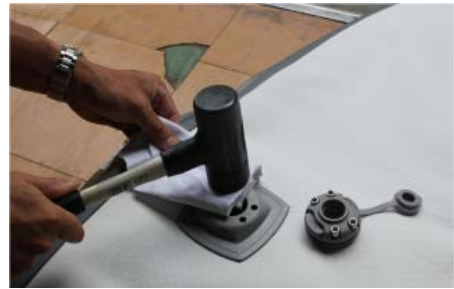
四角ベースの中央部分はウエス等で 当て布し保護してゴムハンマーで圧着