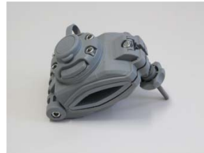
品番 : BK-FMCG 品名 : クランプ & マウント 価格 : ¥6,300+税 カラーグレー