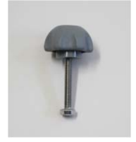
品番 : BK-KN223G 品名 : ノブナット ショートネジ 付 価格 : ¥950+税 カラーグレー