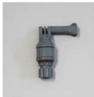
品番 : BK-NG003G 品名 : GO PRO用マウント 価格 : ¥2,100+税 カラーグレー