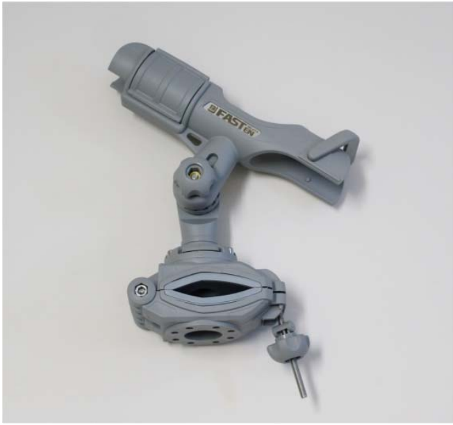
品番 : BK100 品名 : クランプ ロッドホルダーグレー 価格 : ¥12,000+税