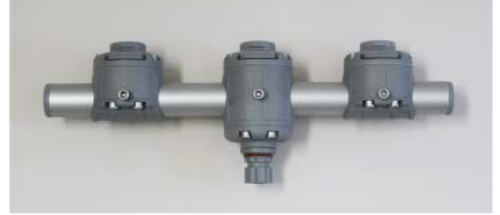
品番 : BK-GM350-3G 品名 : 3連マウント グレー 価格 : ¥16,200+税