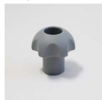
品番 : BK-KN222G 品名 : ノブナット ロング 価格 : ¥800+税 カラーグレー