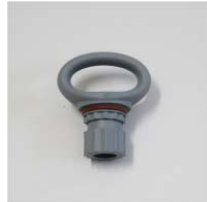
品番 : BK-RM273G 品名 : リングアイ 価格 : ¥1,000+税 カラーグレー