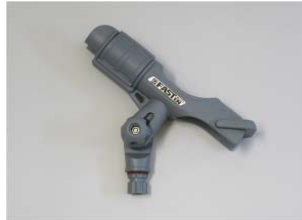
品番 : BK-HT213G 品名 : ロッドホルダー 価格 : ¥5,900+税 カラーグレー