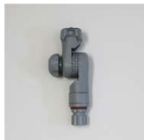
品番 : BK-TP014G 品名 : カメラ用マウント 価格 : ¥6,900+税 カラーグレー