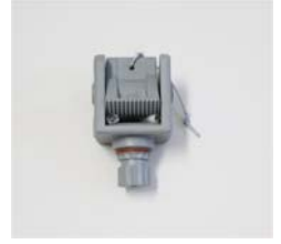
品番 : BK-AL002G 品名 : アンカーロック 価格 : ¥7,000+税 カラーグレー