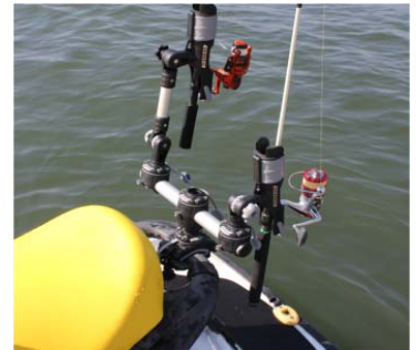
エクステンション付ロッドホルダーと ロッドホルダーを装着したイメージ