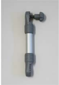
品番 : BK-EX225G 品名 : エクステンション205mm 価格 : ¥3,300+税 カラーグレー