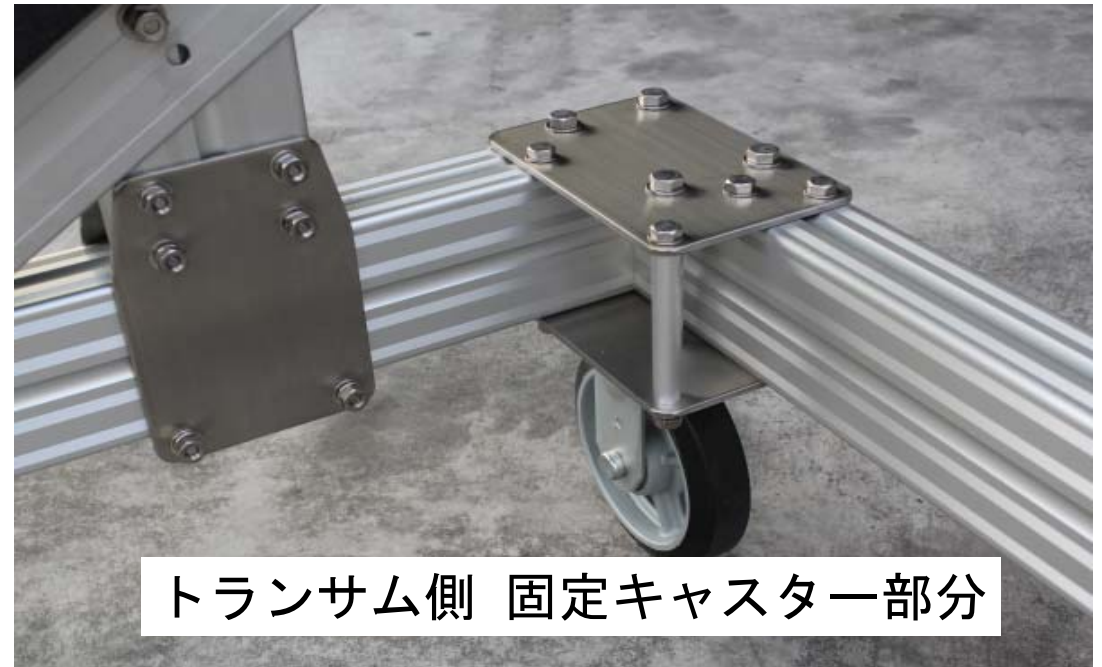
トランサム側 固定キャスタ一部分