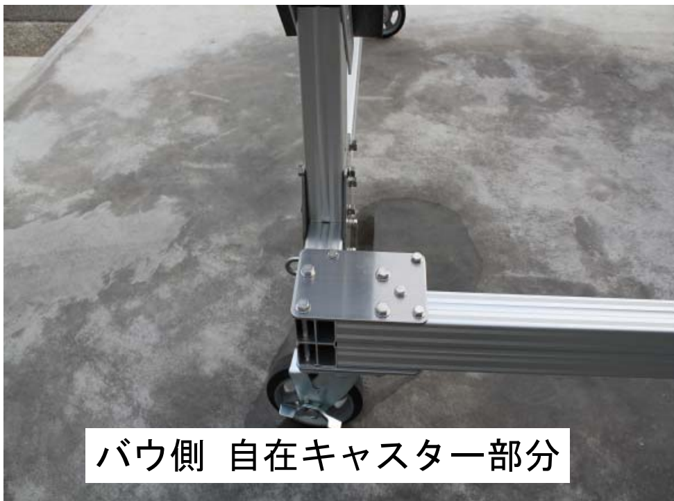
バウ側 自在キャスタ一部分