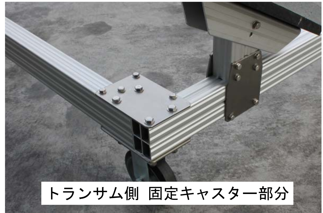
トランサム側 固定キャスタ一部分