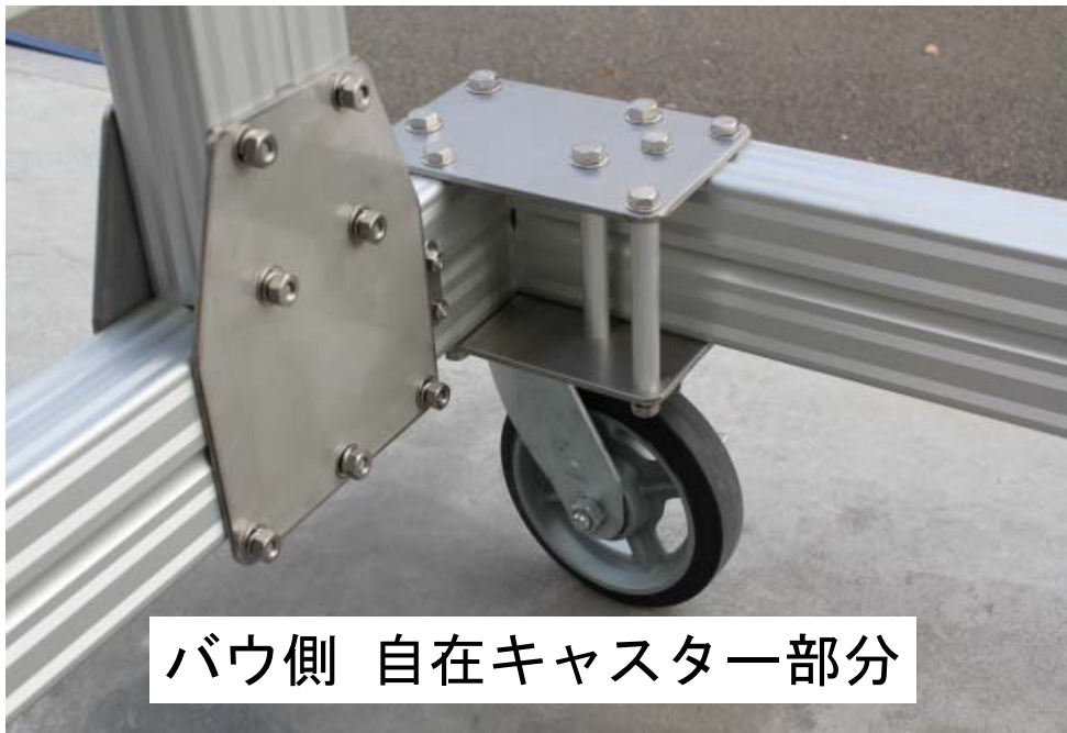
バウ側 自在キャスタ一部分